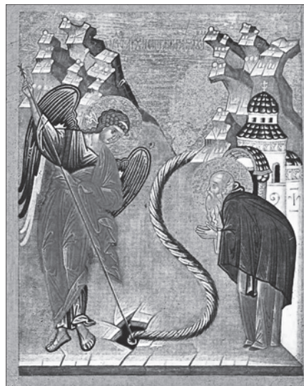
Чудо Архангела Михаила в Хонех. Новгород. Кн. XV — нач. XVI вв.

12 сентября — Обретение мощей блгв. кн. Даниила Московского (1652 г.). Перенесение мощей блгв. вел. кн. Александра Невского (1724 г.).